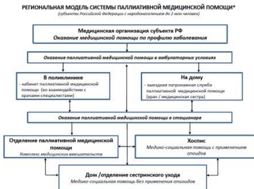
Рис.1. Региональная модель системы паллиативной медицинской помощи для субъектов Российской Федерации с населением до 2 млн. человек (Новиков Г.А. и соавт., Паллиативная медицина и реабилитация. – М.: №3. -2015).

На рис.1 представлена модель системы паллиативной медицинской помощи для субъектов РФ с населением до 2 млн. человек. На одно из структурных подразделений системы паллиативной медицинской помощи целесообразно возлагать функциональные обязанности организационно-методического центра с функцией анализа состояния паллиативной медицинской помощи населению, эффективности и качества лечебных мероприятий и диспансерного наблюдения больных на территории субъекта Российской Федерации. Организационно-методический центр паллиативной медицинской помощи должен находиться в функциональном взаимодействии с органами управления здравоохранения субъекта.