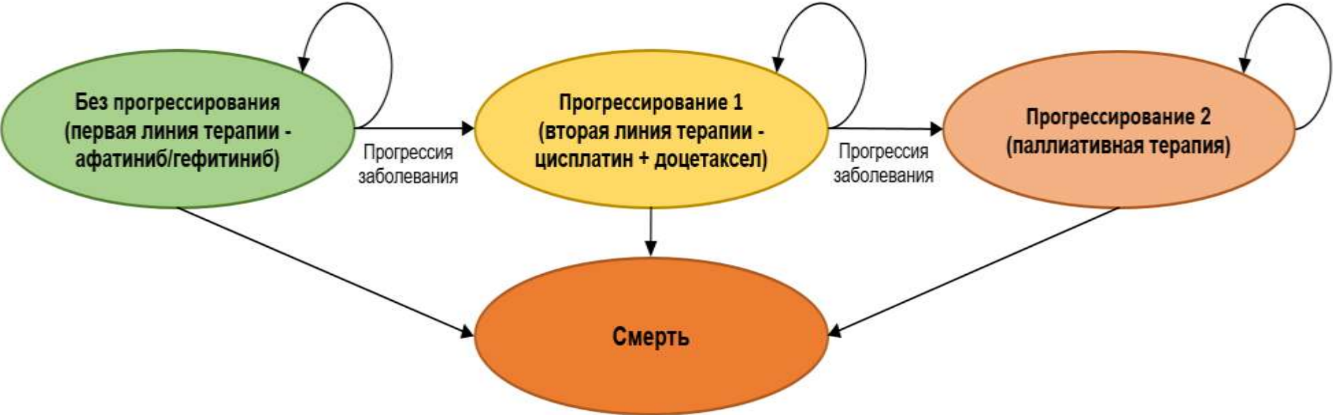
Схема цикла Маркова, примененного в модели